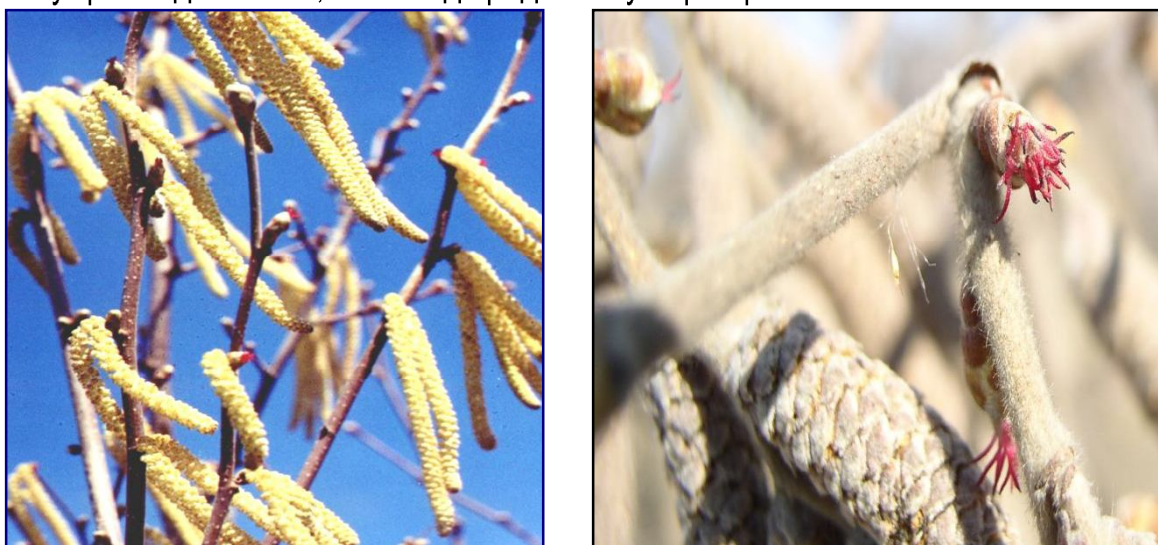
Рисунок 1. Цветение пестичных и тычиночных цветков (в коллекциях ФГУП «Волгоградское», сорт Черкесский-2)

Многолетними исследованиями установлено, что лимитирующими факторами для интродукции орехоплодных кустарников в центральной части Нижнего Поволжья являются недостаточное увлажнение, частое повторение засушливых лет, низкие зимние температуры при неустойчивом снежном покрове. Для мужских соцветий (отсутствие пыления) является понижение зимних температур до -37^{\circ}\text{C} . [4, 8]. На светло-каштановых почвах сорта фундука вступают в генеративную фазу с 4-5-летнего возраста. Цветочные почки раздельнополые, распускаются до появления листьев (рисунок 1). Закладываются на побегах текущего года в июле, т.е. в год предшествующий цветению.